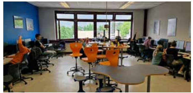
So sieht der Raum des MINT-Zentrums aus.

Ein Ort der Innovation und Kreativität hat an den BSGG die Tore für uns Schüler:innen der MBS geöffnet: das MINT-Zentrum. Hier können wir in den Bereichen Programmierung und 3D-Design erste Schritte machen. Das Zentrum bietet eine spannende Plattform, um die Möglichkeiten der modernen Technologie zu erkunden und das eigene Wissen auf diesen Gebieten zu erweitern.