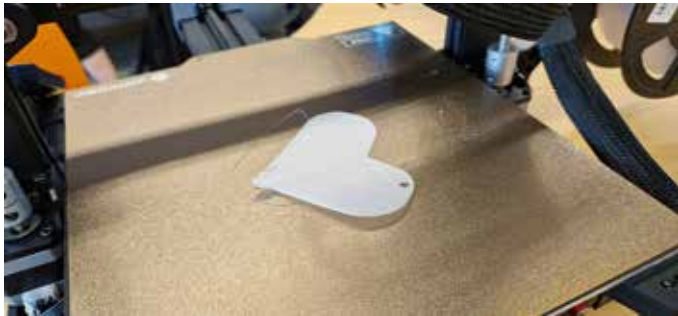
Ein 3D-Drucker bei der Arbeit