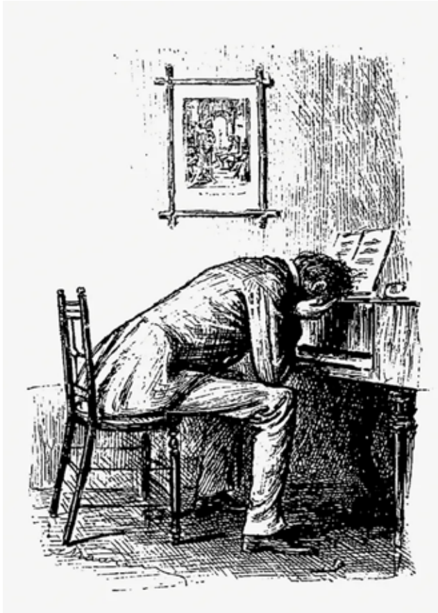
Sad pianist from Peter Ibbetson, Etc published by J.R. Osgood & Co. (1892). Free CC0 Image.