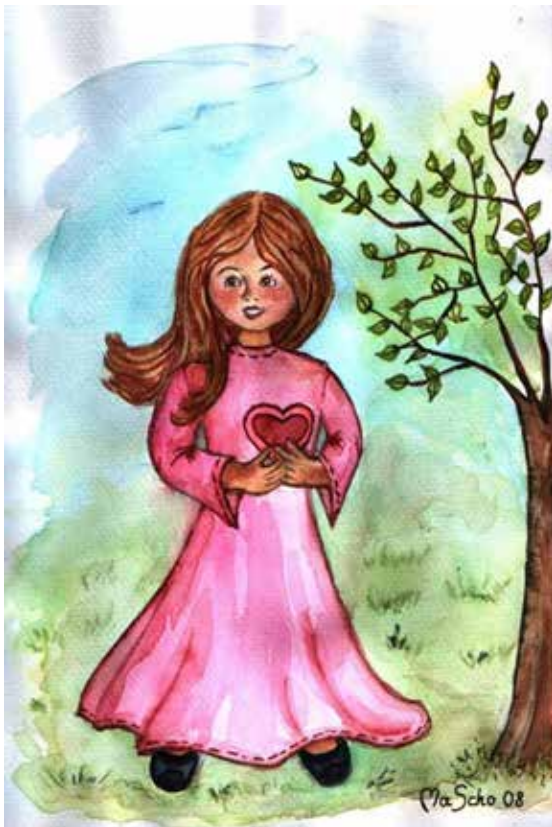
"Mädchen - MagdalenaKunst"