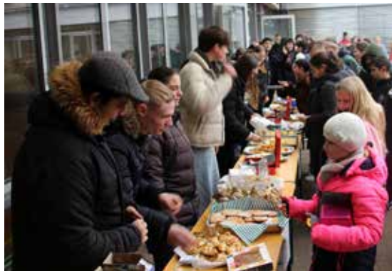
Verkauf von Leckereien auf dem Schulhof

In der anschließenden Pause konnten sich die Gäste und Musiker am Buffet