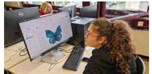
Die Oberfläche von Onshape

Eine der aufregendsten Facetten des MINT-Zentrums ist die Programmierung. Wir haben hier die Möglichkeit das Programmieren zu lernen. Als wir am 10.5. und 24.5. an den BSGG schnuppern konnten, wurde uns die Sprache Python erklärt, und wir konnten erste Schritte damit machen. Von der Entwicklung eigener Apps sind wir zwar noch etwas entfernt, aber die Steuerung von Robotern oder LED-Anzeigen bietet bereits viel Raum zum Herumspielen, als auch für ernsthafte Anwendungen. Wir konnten unsere neue erworbenen Fähigkeiten an den vielen Anzeigen und Robotern des MINT-Zentrums erproben und konnten uns kreativ betätigen.